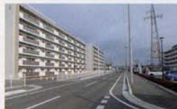
避難道路釜大街道線と 市営三ツ股第二復興住宅