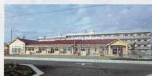
石巻市立釜保育所