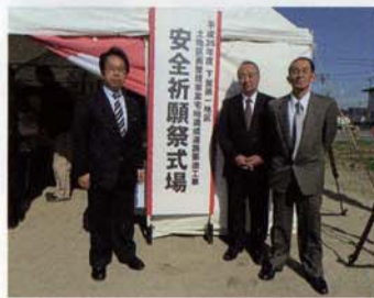
土地区画整理事業工事安全祈願祭 (町内会役員の皆さんと)