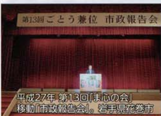
平成27年 第13回「ま心の会」移動「市政報告会」。岩手県花巻市