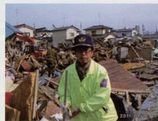
地元の被災現場で捜索活動!!