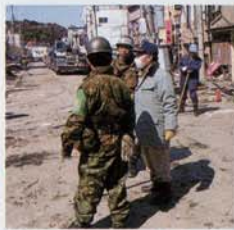
被災した市中心部(広小路)で インフラの復旧活動!!