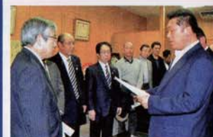
被災農家の皆さんと園芸団地 早期整備を亀山市長に陳情