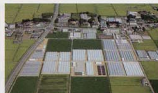
完成した園芸団地(須江地区)