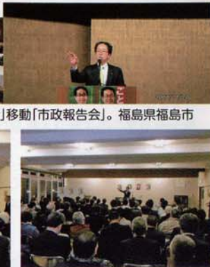
亀山市長と共に「市政報告会」を開催