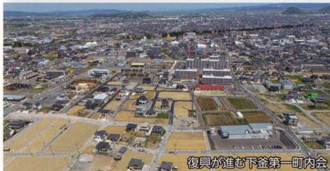
復興が進む下釜第一町内会