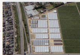
完成した園芸団地(蛇田地区) 総事業費は2か所約23億円