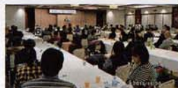
平成29年 第15回「ま心の会」移動「市政報告会」。福島県福島市