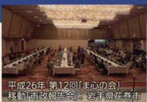
平成26年 第12回「ま心の会」移動「市政報告会」。岩手県花巻市